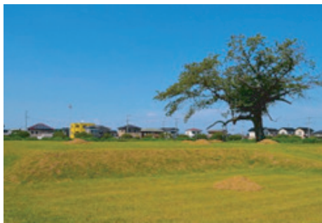
常陸国分尼寺跡の様子

石岡市に残る「常陸国分尼寺跡」は、奈良時代に国家が主導して整備した寺院ネットワークの一つである。聖武天皇が全国に建立を命じた国分寺・国分尼寺は、当時の国家体制を象徴する重要な施設であった。現在の石岡市の地、常陸国でも国府の近くに男女一対の寺院が置かれていた。現在の、国分寺跡は石岡市府中、国分尼寺跡は若松に位置しており、両方の史跡が残されている。この双方の史跡が残され、かつ国指定文化財と認められている場所は全国でも類を見ない。「歴史の町石岡」ならではの。