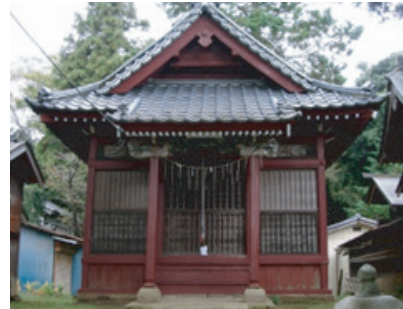
「日天宮」拝殿の様子

太陽の社『日天宮』は、市街地 の西側の国府七丁目鎮座する。 天照大神を祀り、参道には二つ の鳥居が並んでいる。周囲には 民家が立ち並び、古くから地域 の暮らしと密接に結びついてき た。稲荷大明神や御岳神社など の小社も並び、地域の信仰の厚 みを物語っている。