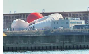
洋上から見た大屋根リング