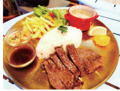
ステーキプレート