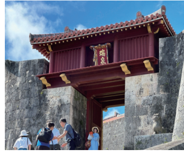
青空と首里城瑞泉門

何かと気忙しい5〜6月にかけての総会シーズンも一段落し、このエッセイを書いていきます。すっかりコロナ時から脱却し（今も一部有りますが）、むしろそれ以前より活発化した行事に加え、どこに行っても海外インバウンドに溢れかえっている今日この頃です。