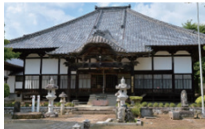
妙法寺本堂の様子

『妙法寺（みょうほうじ）』は茨城県桜川市本郷にある天台宗の寺院である。桜川市の北西に位置する。天台宗の古刹として知られる。正式名称は、「秋嶠山地蔵院妙法寺」といい、本堂内には即身仏、「ミイラ」が祀られている関東唯一の寺院として知られている。ご本尊は延命水引地藏菩薩で、本堂内に安置される即身仏は瞬義上人のものとする。歴史は古く、延暦年間（782〜805）に、下野国大慈寺の広智国講師が、坂戸庄上野原地（現岩瀬町内）に草堂を創建し、千手大悲の像を安置した。それを晶屋精舎（あきやしょうじゃ）と名づけたのが始まりである。