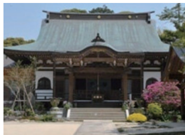
二本松寺本堂の様子

潮来市の二本松寺（にほんまつじ）。天台宗羽黒山覚城院二本松寺という。平安時代の天長年間（824年）、慈覚大師円仁によって現在の潮来市茂木に創建されたと伝えられている。鎌倉時代の建久2（1191）年にこの地区の豪族であった嶋崎氏初代の左衛門尉高幹公が嶋崎城築城の際に京都・比叡山を模し、鬼門除けとする1ヘクタールの敷地を寄進し、現在の地に移転し開山した。その際に境内を城郭とし、嶋崎城の砦の役割をもたせている。1600年程、嶋崎氏代々の祈願寺として繁栄し、天正19（1591）年の滅亡後、佐竹氏、水戸徳川氏の信仰を受け、末寺25の寺を統轄する本寺として隆盛を極めた。