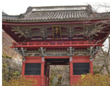
県指定重要文化財の仁王門の様子

茨城県桜川市にある『雨引観音』は安産子育ての信仰で知られている関東屈指の寺院である。安産の信仰を集めている本尊の観世音菩薩（延命観音）は、木造で弘仁期（810〜824年）の密教彫刻の特徴を示し、前立の観音も鎌倉時代の作といわれている。本尊が観音様であることから「雨引観音」と呼ばれ、親しまれてきた。この『天引観音』は、「雨引山楽法寺」の通称で、坂東三十三観音第24番札所、また、東国花の寺百ヶ寺茨城6番札所とされている。以前は、聖武天皇や光明皇后の帰依も厚く、弘法大師によって真言宗の道場となった真言宗豊山派の寺院である。創建については、中国から帰化した法輪独居居士が587年に開山したと伝えられる。