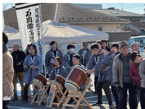
当社の駐車場で お囃子の操演