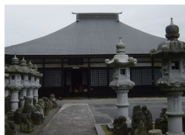
長興寺本堂の様子

現在のかすみがうら市中志筑に位置する鳳林山長興寺（ちようこうじ）。この地には、かつて常陸国新治郡の志筑陣屋に藩庁を置いた「志筑藩」があり、江戸時代初期に秋田からやってきた本堂家が10代にわたって領主として治めていた。新撰組に参加した伊東甲子太郎や鈴木三樹三郎も志筑藩に所属していた。本堂家は明治時代の廃藩置県まで、約70年の間統治をしていた。本堂家が常陸国にやってきて、石岡市の威徳院に入り、かすみ