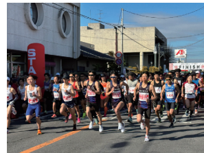
スタート地点が当社前

2月の晴れ渡る青空の中、5・4・3・2・1・スタートのピストルが鳴り響き招待選手を先頭に多くのランナーが一齐に走り出しました。これは当社前をスタート地点、ゴールをイベント広場とする「第1回石岡つくばねハーフマラソン」の様子です。当社駐車場に陣取った「石岡囃子」の面々が選手たちにエールを送り、前夜祭に引き続き有森裕子さんが大会全般を盛り上げます。