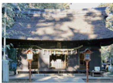
國王神社拜殿の様子

國王神社(こくおうじんじや)は、茨城県坂東市にある神社であり、平将門の終焉の地に平将門を祀る神社である。ここに祀られている平将門は、平安時代の中期に現在の坂東市付近を本拠として関東一円を平定し、剛勇の武将として知られた平家の一族である。 平将門は平安時代に活躍した関東の豪族としてよく知られているが、現在の千葉県北部から茨城県にかけて勢力を伸ばし、現在の坂東市に政庁を置いた。その後、朝廷側から討伐された。天慶3(940)年2月、平貞盛、藤原秀郷の連合軍と北山で激戦中、流れ矢により38才の若さで戦死したと伝えられる。その後、長い間叛臣の汚名をきせられたが、民衆の心にのこる英雄として國王神社に祀られた。