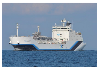
すいそ・ふろんていあ号

（いつも日本では神戸空港隣のハイストラにいます）勿論これからクリーンエネルギーとして期待される水素分野で、日本の技術をアピールする為です。2025の関西大阪万博においては水素旅客船が就航する予定です。2030には川崎扇島に大型水素運搬船の着岸基地が出来る予定です。その頃には各国首脳（西側ばかりでなく）の間でもっと明るい前向きな話題が議論できるようになれば良いですね。