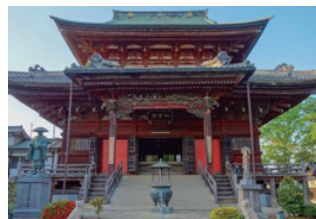
不動院本堂の様子

不動院(ふどういん)は、つくばみらい市にある真言宗豊山派の寺院で、正式名称は清安山願成寺不動院(せいあんざんがんにょうじふどういん)という通称で板橋不動尊(いたばしふどうそん)と呼ばれている。寺伝によれば、不動院の開創は古く、大同年間(806~10)に空海(弘法大師)が開山。天授六年(1380)には、名僧として名が知られている、祥海阿闍梨が七堂伽藍を建立した。しかしながら、その後の嘉吉・天正の二度にわたる兵火で焼失し、文禄年間(1592~96)に霊雲阿闍梨が入山して復興、現在に続いている。また、元禄年間(1688~1703)に建立された楼門には、阿吽の仁王像が安置されている。正面の本堂は、二重屋根組物・入母屋造りで、元文2年(1737)に不動院中興の祖といわれる高僧・霊雲阿闍梨が建立したものである。