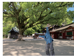
太宰府天満宮にて