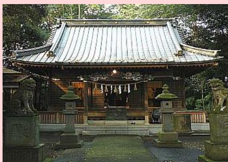
八坂神社の境内の様子。

土浦市には八坂神社がいくつか存在するが、真鍋の八坂神社は土浦の総鎮守で、「鎮守」とは土地や建物を守る神様を意味する。江戸時代には「郷社」という位置づけで、広範囲の信仰を受け、江戸時代には土浦城の鎮守として、土浦藩藩主である土屋氏の崇敬を受けた。現在の鳥居や本殿は土屋氏が建てたものである。