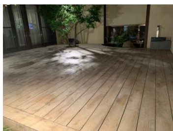
夕方にライトアップした様子。BBQ等には最適ですね！

のタイルデッキは人工木デッキと違い工期はかかりますが手作り感満載の味があるお庭が完成しました。自然石と植栽が調和し、静けさをも愉しむ、日本庭園を思わせながら、