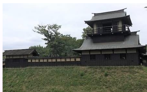
現在の復元された逆井城の外観。

逆井城(さかさいじょう)は、下総国猿島郡、現在の茨城県坂東市逆井にあった戦国時代の平城である。この土地は、当時近隣領地を治めていた佐竹氏・結城氏・多賀谷氏との領国の境目にあたり、すぐ北側にある自然の要害である「飯沼」に囲まれていたため堅牢を誇っていたと考えられる。