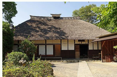
佐久良東雄旧宅の様子

いう。ちなみに、今もこの生家は飯嶋姓の子孫が守っている。佐久良東雄は、幼少の頃から文学の才に優れ、日本の古典を学び、勤皇の志を深めていった。9歳という年齢で若くして仏門に入り、15歳で万葉和歌を得度し、22歳で近くの観音寺の住職となった。天保6年(1835)、25歳にして土浦真鍋の善応寺住職になった。土浦藩をはじめ、水戸、笠間藩、遠くは九州の各藩、そして江戸・京都などの有志が訪れたという。この頃から王政復古の念が強まっていった。