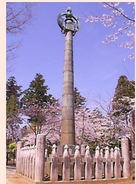
国指定文化財の相輪櫓(そうりんとう)

行方市の旧玉造町に位置する寺院、天台宗西蓮寺。西蓮寺は歴史があり国指定文化財の仁王門・相輪櫓(そうりんとう)など文化財や史跡が多い。