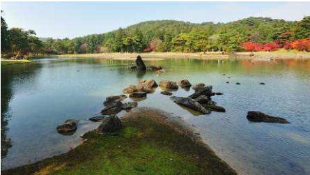
国の特別史跡と特別名勝の二重指定を受け ている日本屈指の文化遺産、大泉が池 を中心とする「毛越寺浄土庭園」

北地方に仏国土(仏の教えに よる平和な理想社会)の実現だ ったそうです。特に「金色堂」は 堂の内外が金箔で覆われた阿 弥陀堂貝の細工や透かし彫り の金具、漆の蒔絵と平安時代後 期の工芸技術を結集した、堂全 体が美術工芸品の感がありま した。